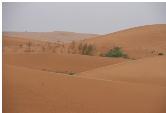
China, Innere Mongolei

Die 9. Jahrestagung der Politischen Kindermedizin hatte die Probleme des Übergangs von der Jugendlichen- zur Erwachsenenmedizin zum Thema, da dieser Prozess insbesondere in Österreich nur in Einzelfällen durch Einzelinitiativen zufriedenstellend verläuft. Bei der Mehrzahl der chronisch kranken PatientInnen verläuft die Transition nicht organisiert und führt zu einer Unterbrechung der Betreuungskontinuität, zu traumatisierenden Orientierungsproblemen und unzureichender Versorgung.